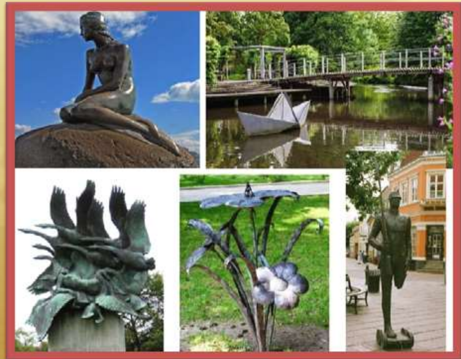
Памятники героям его сказок